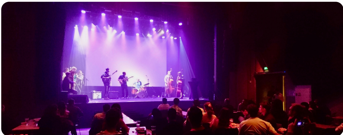
Underholdning på Young Researchers Night i Trondheim.