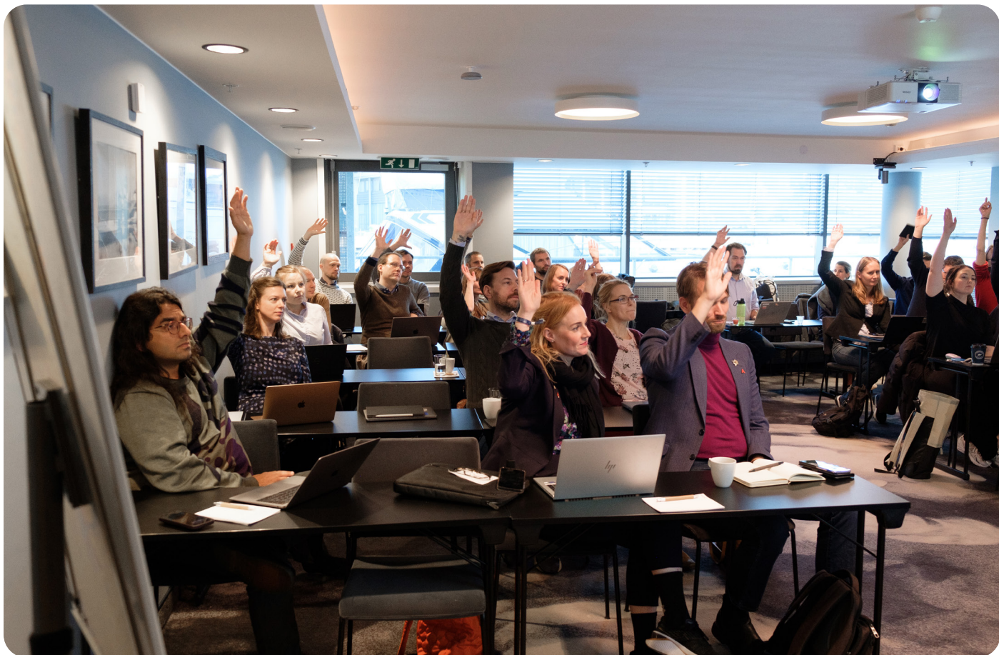
AYF-medlemmene avgir sine stemmer på høstsamlingen i Trondheim 2023.