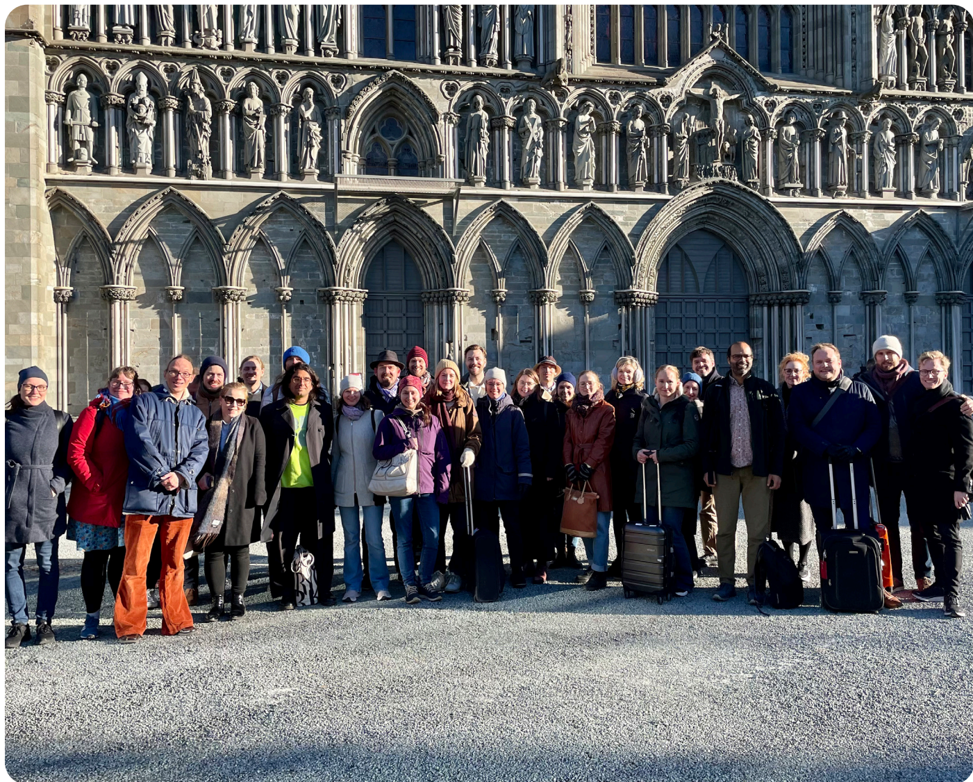
Høstsamling 2023 i Trondheim.