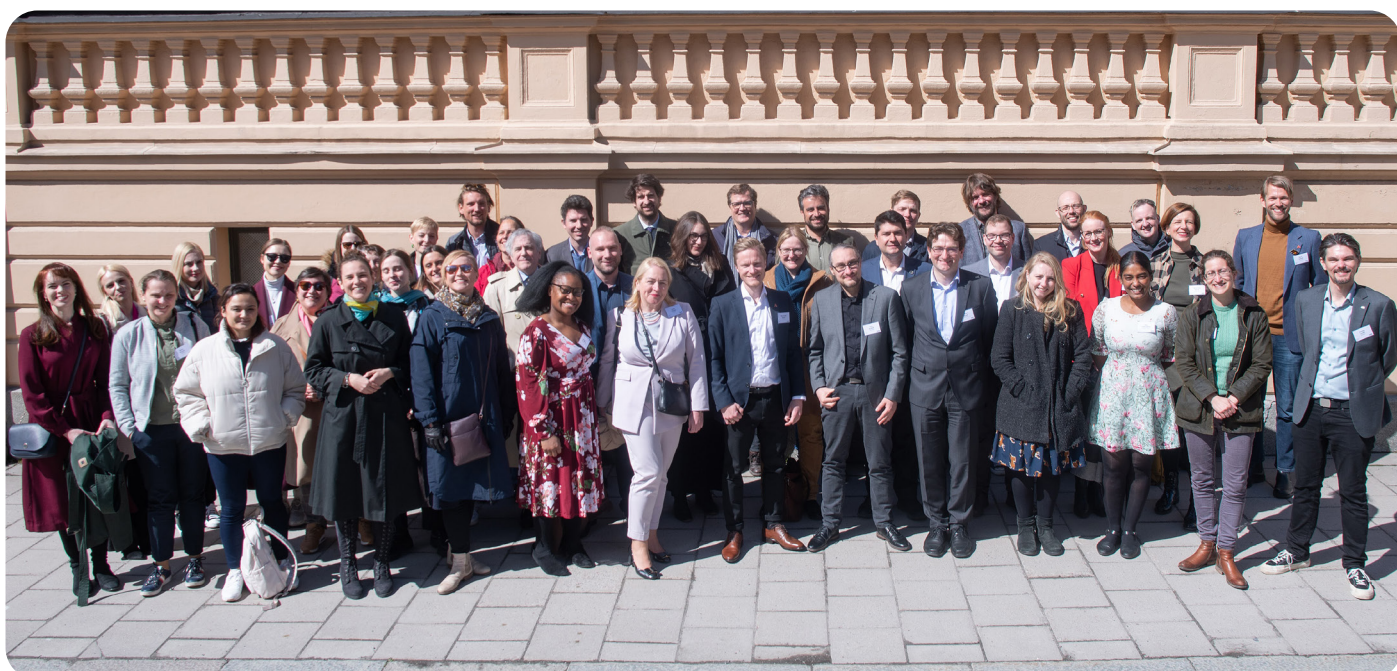
Gruppebilde fra ENYA-møtet 3.-4. mai i Stockholm.

Fortsette arbeidet, belyse og foreslå politiske løsninger for å bedre den akademiske friheten både nasjonalt og internasjonalt