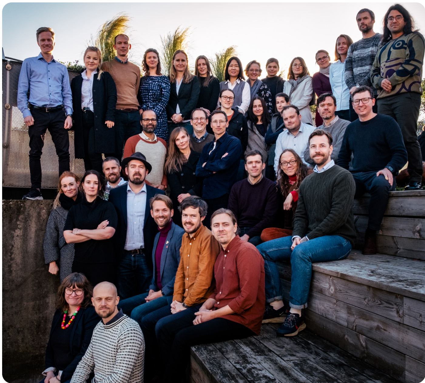
Gruppebilde høstsamling 2023 i Trondheim.

Vi mottok 65 søkere noe som er 15 flere enn i 2022. Av disse ble 20 invitert til intervju og 10 av disse ble tatt opp som medlemmer.