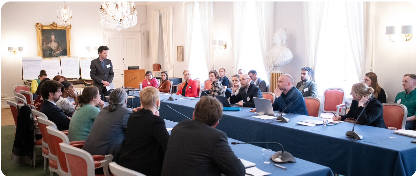
Diskusjoner fra ENYA-møtet i Stockholm.

I september tilsluttet vi oss et felles leserinnlegg med de andre akademiene i Norge at det trengs et sterkt forskningsråd.