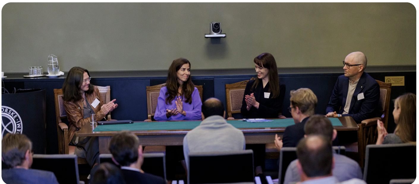
Panelsamtale under Nordic-Baltic meeting.