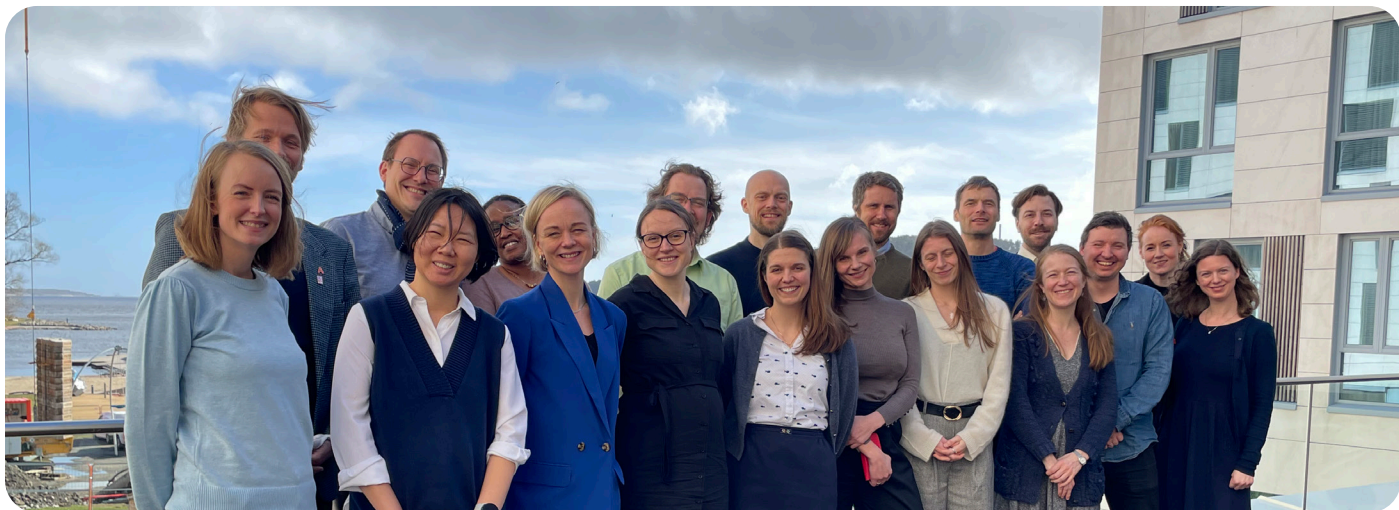
Medlemmer på vårsamling i Kristiansand.

23-24. mars besøkte AYF Kristiansand for første gang. Vi hadde et spennende program som hadde mangfold og formidling som tema.