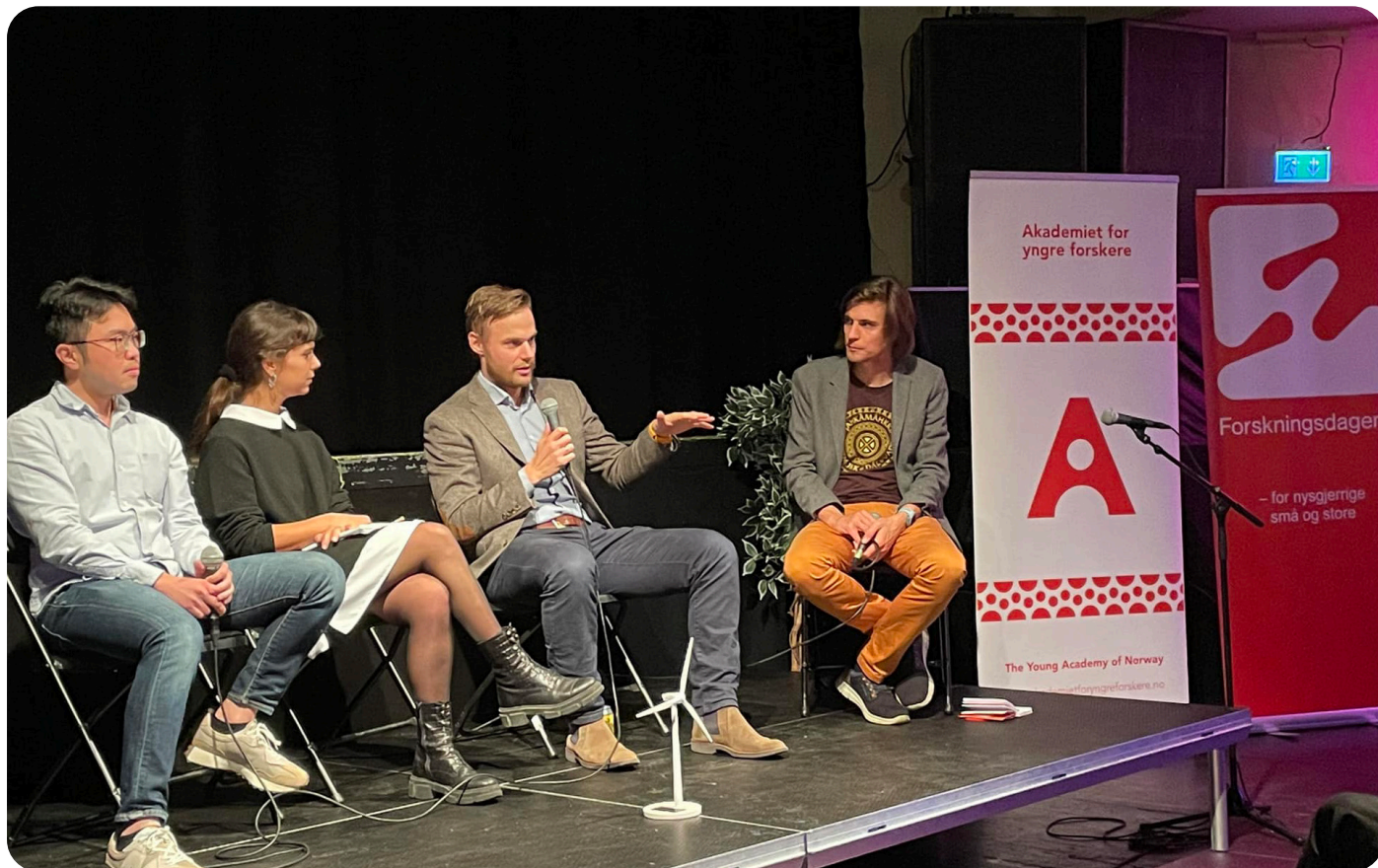
Young Researchers night i Stavanger.

29. september arrangerte vi Young Researchers Night i Bergen, Kristiansand, Oslo, Stavanger og Trondheim. YRN er alltid siste fredag i september og gjennomføres i forbindelse med Forskningsdagene. Alle arrangementene var meget godt besøkt og i både Bergen og Oslo var det fulle hus. Tema for årets forskningsdagene var energi.