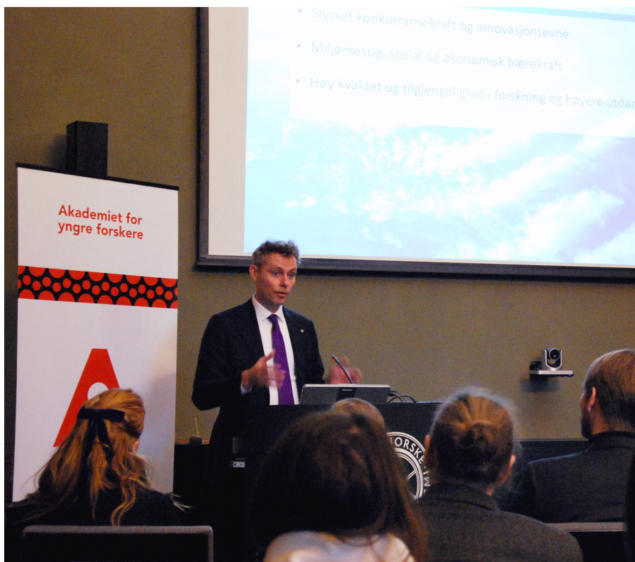
Tidl. minister Ola Borten Moe møter AYF.

Daværende Forsknings- og høyere utdanningsminister Ola Borten Moe gjestet samlingen og vi utfordret han på Regjeringens forskningspolitikk. Det var et godt oppmøte med 35 påmeldte. Les mer om samlingen på vår nettside .