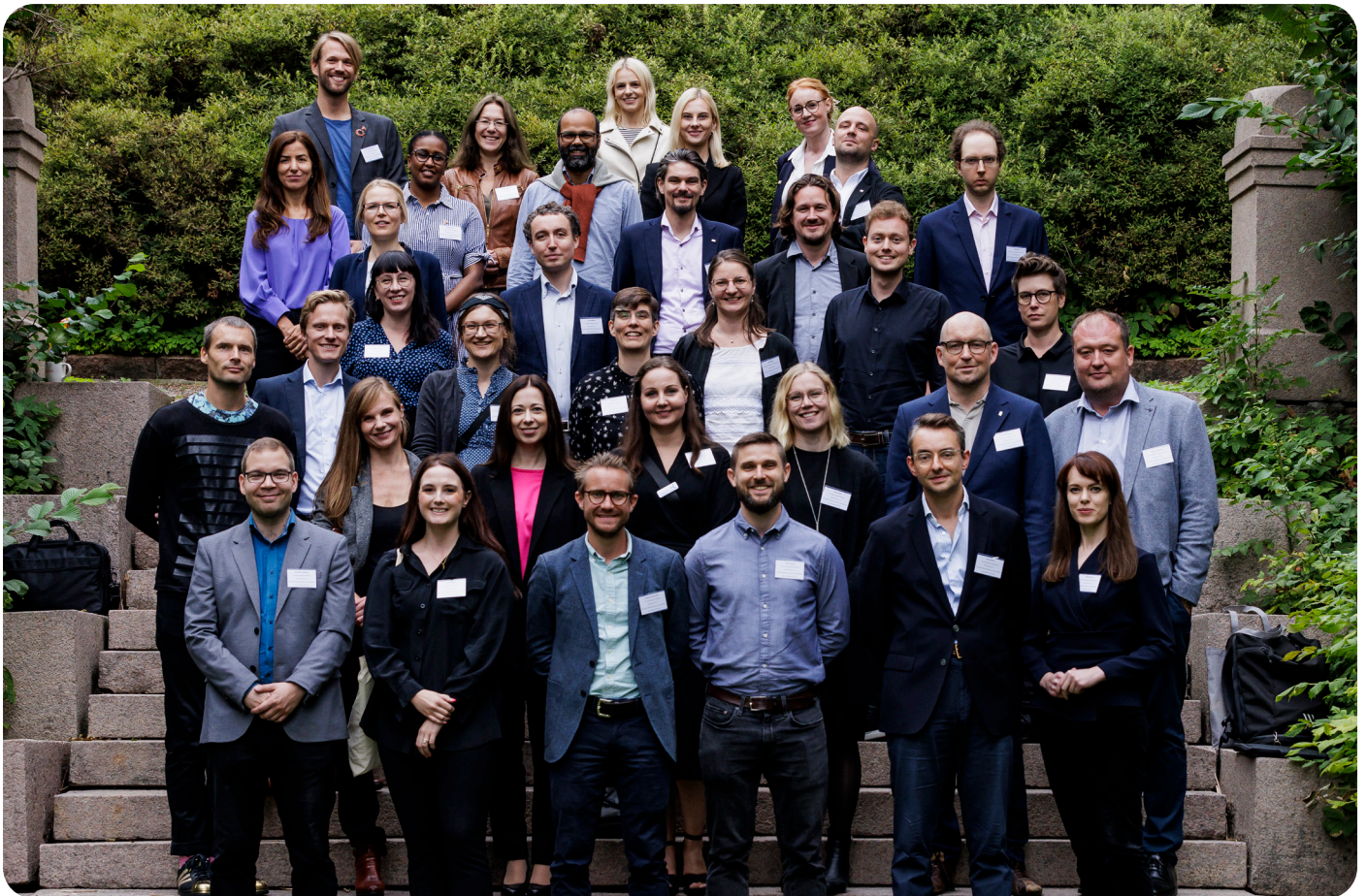
Deltagere på Nordic-Baltic Meeting samlet i Oslo.

Vi var 35 personer hvorav en fulltallig delegasjon på 10 personer fra AYF. Takk til Nordforsk og Letten Foundation for deres støtte til å gjennomføre møtet. Det nordisk-baltiske møtet har blitt en viktig arena og vi har knyttet sterke bånd mellom våre akademier. Det neste nordisk-baltiske møtet vil være i København i april og i 2025 vil det arrangeres i Estland.