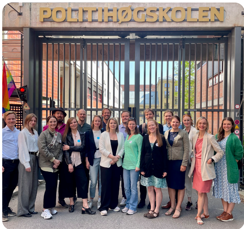
Sommersamling i Oslo: Foto: AYF

På kvelden ble alumni invitert og det var på Niels Henrik Abels hus på Blindern. Les mer om samlingen på vår nettside .