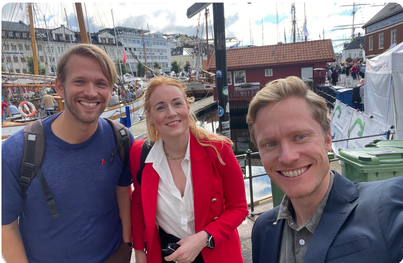
Ledelsen på Arendalsuka 2023.