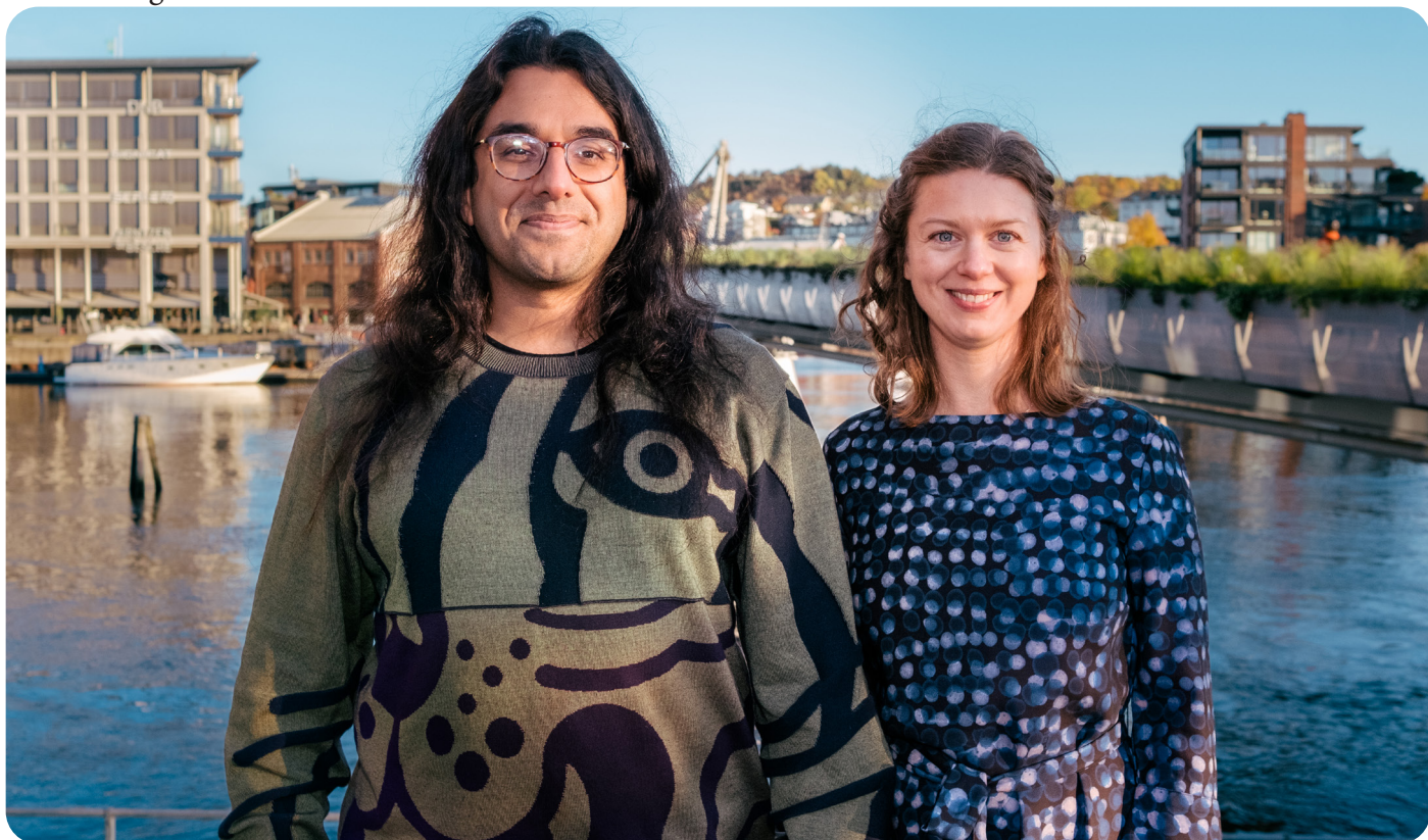
Ny ledelse på plass fra høstsamlingen 2023.