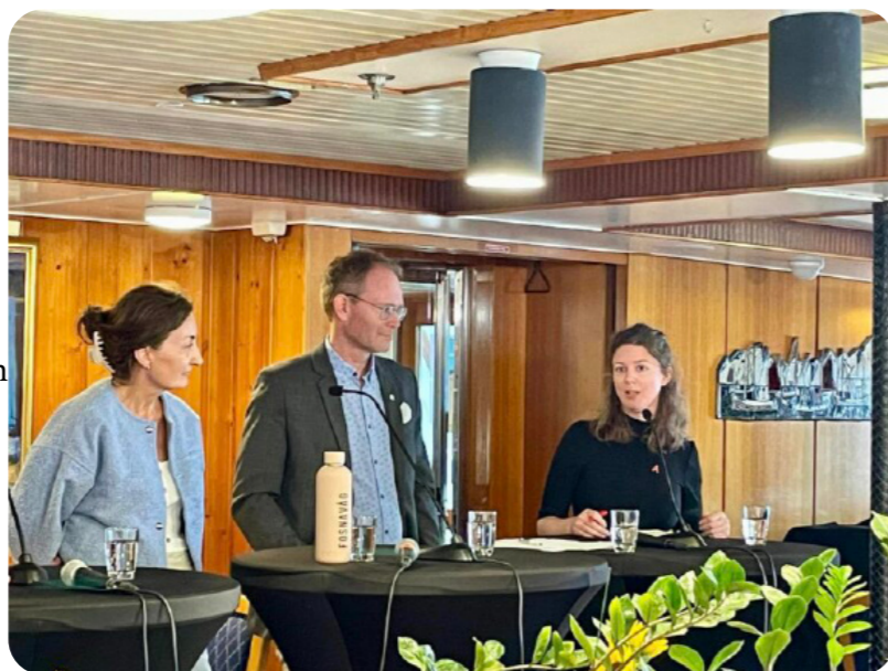
Nora i debatt under Arendalsuka.

AYF fikk markert seg godt under Arendalsuka, og vi ser frem til å delta også i årene som kommer. Les mer om Arendalsuka 2024 her .