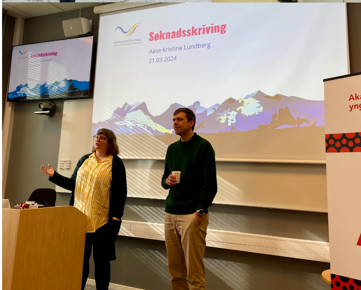
Akademiet for yngre forskere - Årsrapport 2024

På kvelden ble alumni invitert sammen med deltakerne på møtet til sommerfest/ alumnitreff på DNVA. Vi var til sammen litt over 40 stykker hvorav 10 alumni deltok. Det er viktig å pleie relasjonen til våre tidligere medlemmer, og vi har nå totalt 54 alumni-medlemmer. Les mer om samlingen her