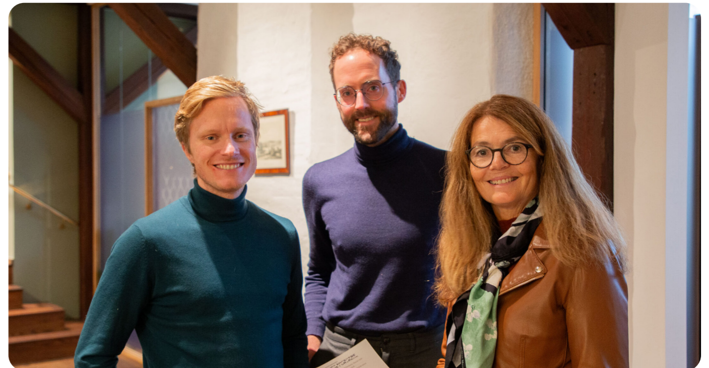
Høsten 2025 inngikk AYF et samarbeid om grunnforskningspris med CAS.

En stor og viktig utvikling er samarbeidet med Senter for Grunnforskning (CAS), som fra 2025 deltar med en egen pris i KUF-regi. Samarbeidet inkluderer i tillegg til prisen også midler til administrasjon av prisen, og er slik det første partnerskapet AYF inngår for å videreutvikle konkurransen. Denne spesialprisen vil spesielt premiere forskningsprosjekter som utfordrer teorier, stiller nye forskningsspørsmål og andre grunnforskningsrelaterte vinklinger. Dette blir en fin modell for å utforske ordninger andre partnere inn i konkurransen slik at den får en stabil finansiering og gode samarbeidseffekter.