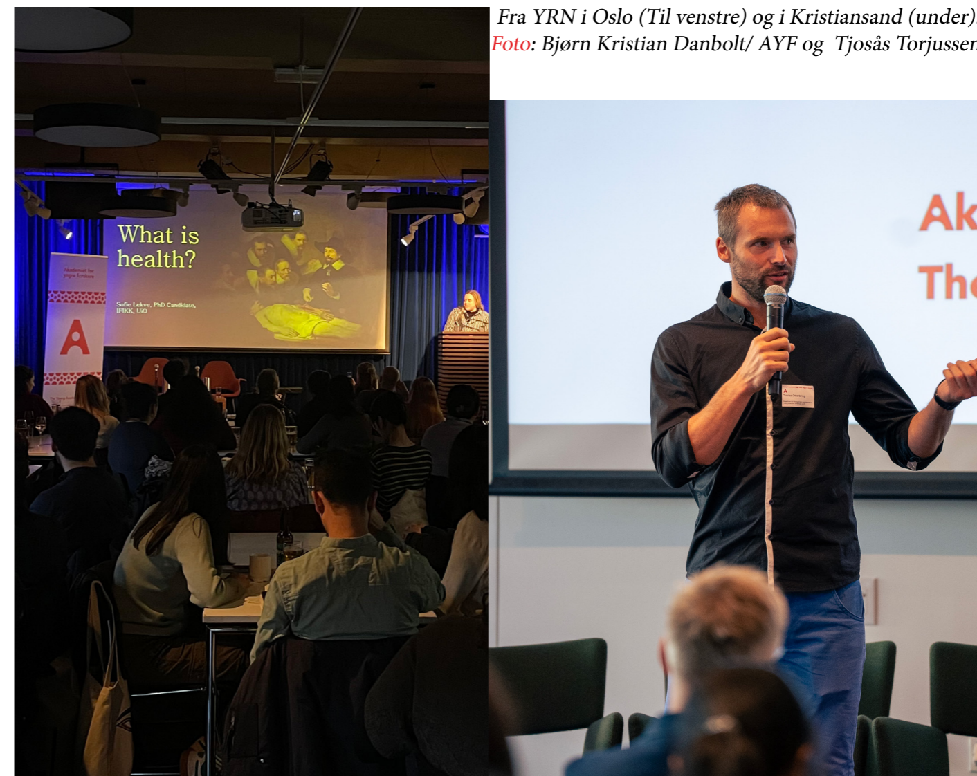
Fra YRN i Oslo (Til venstre) og i Kristiansand (under).

Av åpne arrangementer har vi hatt nettmøte for medlemskap i AYF, felles arrangement under Arendalsuka og de seks Young Researchers Night-arrangementene.