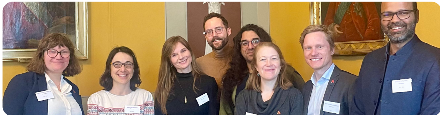
Delegasjonen fra AYF i København.

NBM er en viktig arena og vi er svært glade for at vi var hele 8 personer fra AYF til stede, noe som gjorde oss til den største delegasjonen. Les mer om årets møte her .