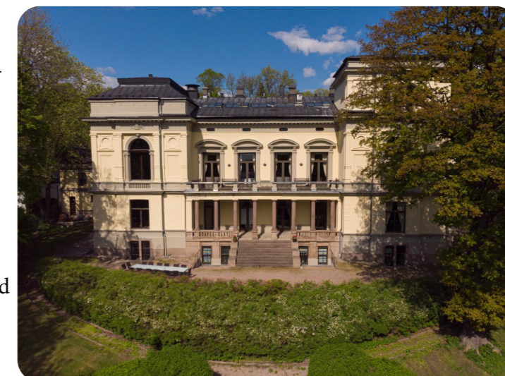
Hovedbygningen på Det Norske Vitenskaps-Akademi.

AYFs medlemmer har en bred faglig, institusjonell og geografisk forankring, og representerer forskningsinstitusjoner fra Bodø i nord til Kristiansand i sør.