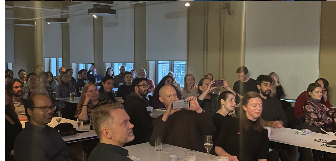
YRN gir mulighet for både faglig påfyll og sosial omgang.