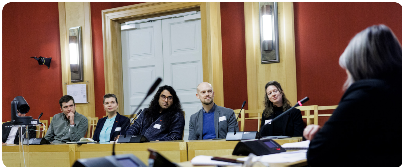
Medlemmene stilte spørsmål til Utdannings- og forskningskomiteen på Stortinget.