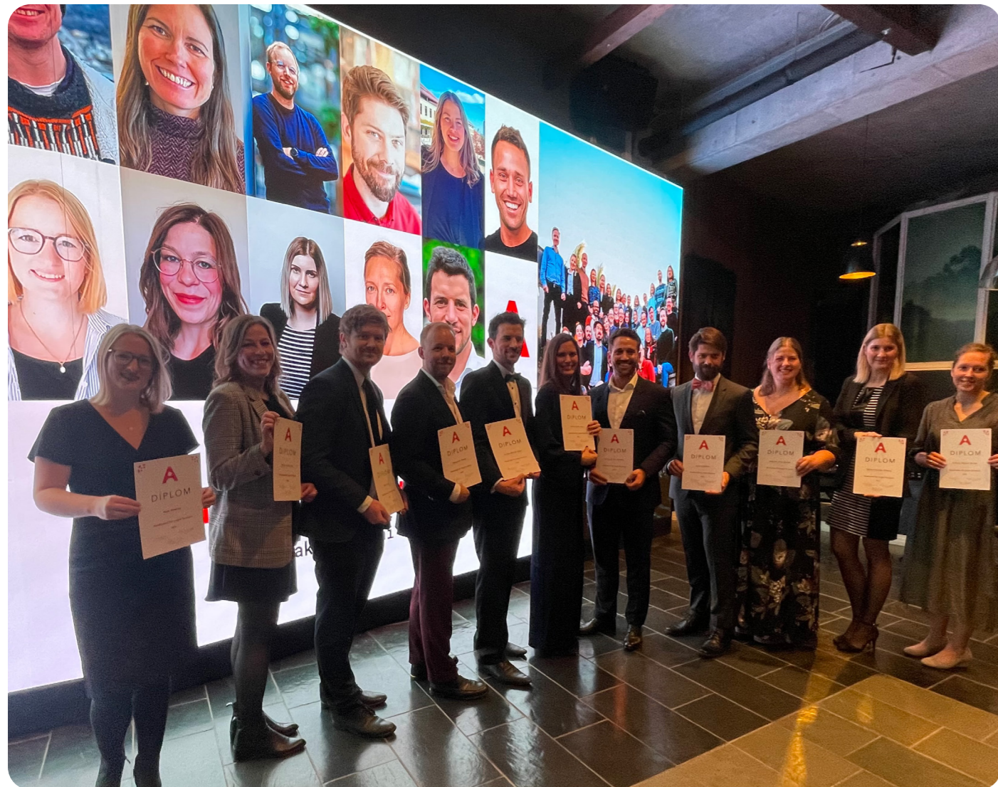
De nye medlemmene tatt opp under høstsamlingen i Bergen.

Vi mottok 72 søkere noe som er 7 flere enn i 2023. Av disse ble 21 invitert til intervju og 11 har fått tilbud om medlemskap og akseptert dette.