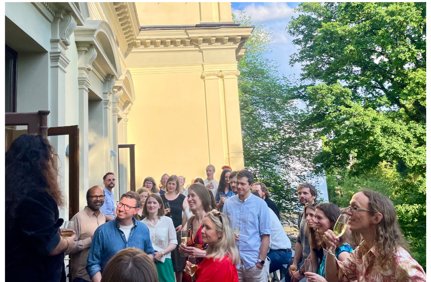
AYF ser frem til et nytt innholdsrikt år.

Samtidig må vi ta høyde for at vi fremover ikke kan gå med underskudd. Dersom vi ikke sikrer flere eksterne inntektskilder, kan dette påvirke aktivitetsnivået. Til tross for dette har AYF en velfungerende, bærekraftig og effektiv drift.