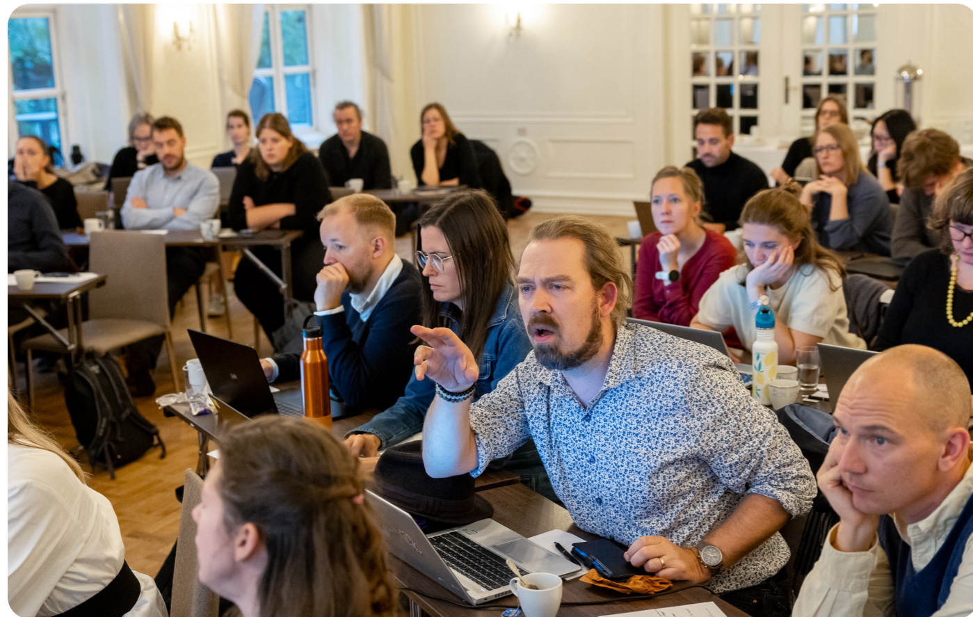
Engasjerte medlemmer diskuterer og vedtar AYF sin politikk under generalforsamlingen.

Samarbeid om Young CAS Fellows: Young CAS Grant er et samarbeid mellom AYF, DNVA og Senter for grunnforskning (CAS), hvor forskere under 40 kan s ke om prosjektmidler til flere samlinger og et kortere forskeropphold ved CAS i Oslo, og lyses ut to ganger om året. I slutten av 2024 inngikk AYF en samarbeidsavtale med CAS om Young CAS og Young Researchers Night. Dette vil styrke v re b nd og knytte Young CAS-programmet tettere med YRN-arrangementene.