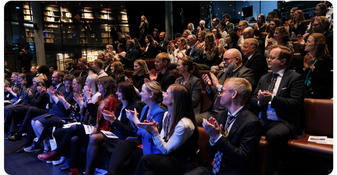
Et stort publikum var til stede for å feire finalistene på finaleseremonien.

Flere grep blir gjort for gjennomføringen 2025, blant annet vil posterpresentasjon komme tilbake til konkurransen. Dette er gjort for at publikum skal kunne bli bedre kjent med finalistene, og for å jamføre konkurransen med de internasjonale konkurransene sine krav.