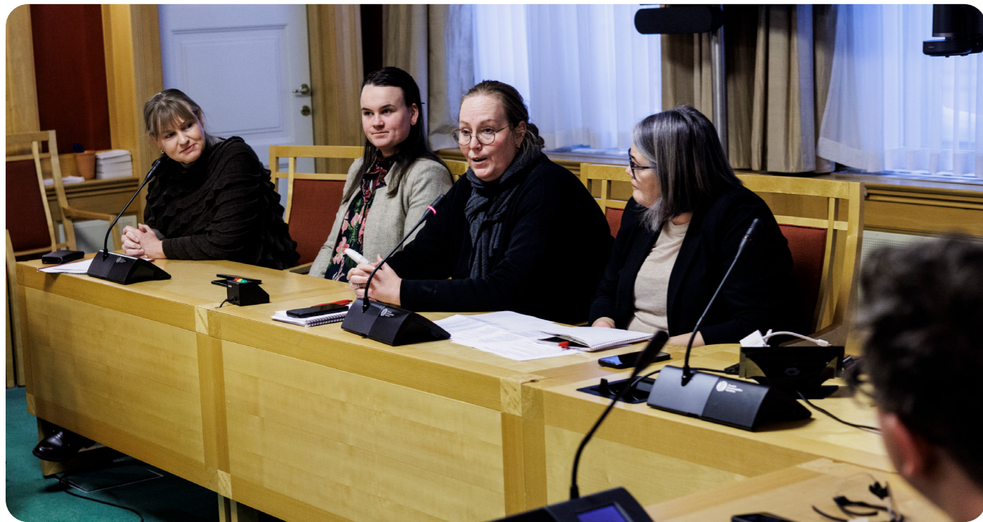
AYF besøkte Utdannings- og forskningskomiteen på Stortinget under vintersamlingen i 2024.