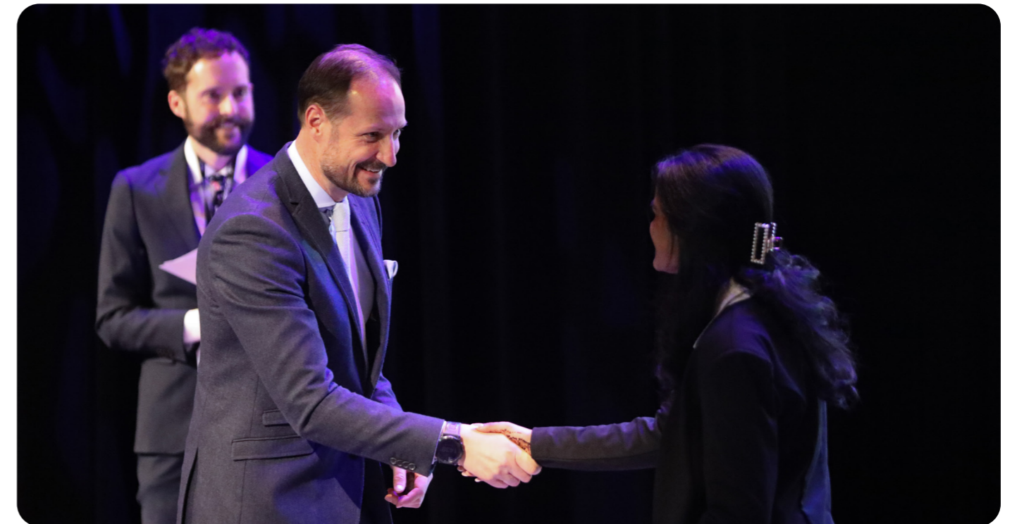
H.K.H Kronprins Haakon delte ut diplom til finalistene på finalen i KUF.

Konkurransen lar AYF utvide sine arenaer og gir en god eksponering inn mot ungdomsskole og videregående skole, og går slik inn i de strategiske målsetningene for perioden 2022-2026 ved å “[...] skape begeistring blant barn og unge for forskningens muligheter”. Gjennom denne formidlingskanalen kan vi skape en bevissthet hos deltakende elever om hvordan forskning forstås og formidles, som kan gi et godt grunnlag for elevenes videre vei inn i høyere utdanning og forskning. Les mer om Konkurransen unge forskere på konkurransen nye nettside .