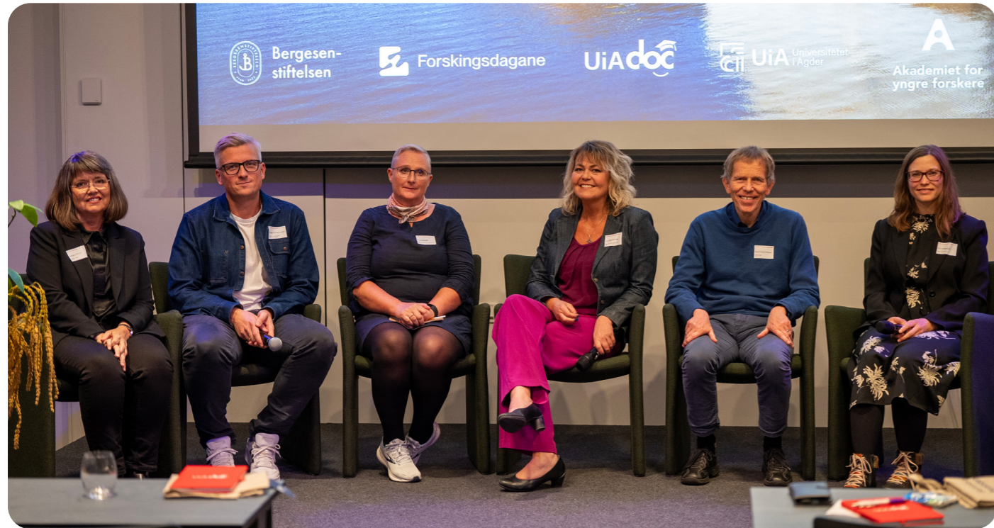
Young Researchers night i Kristiansand.

Årets tema var helse, og arrangementene hadde stort sett godt oppmøte. Young Researchers Night er en viktig arena for å synliggjøre AYF som et landsdekkende nettverk, samtidig som det gir oss en verdifull mulighet til å nå unge internasjonale forskere.