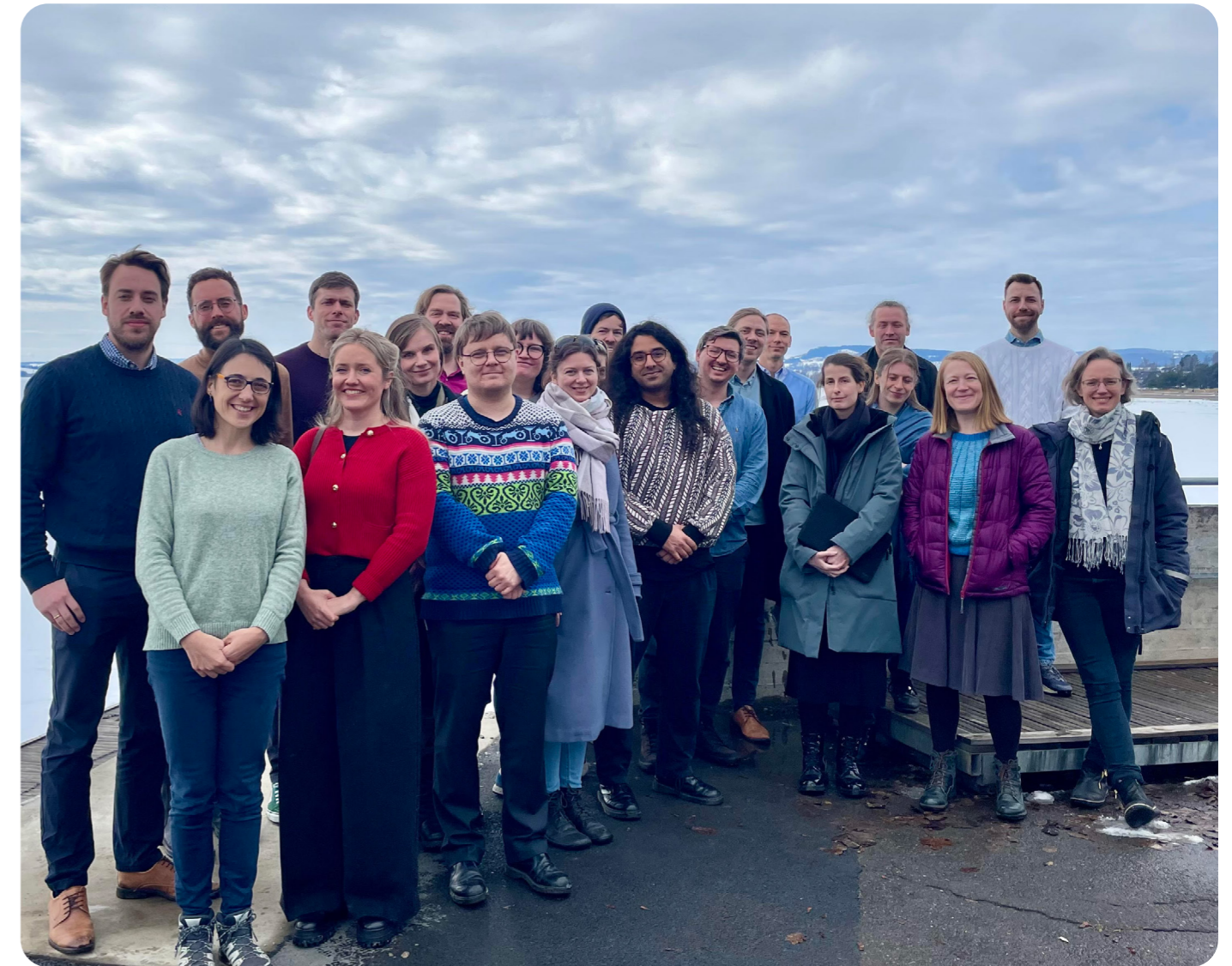
AYF-medlemmene på vårsamlingen på Hamar.