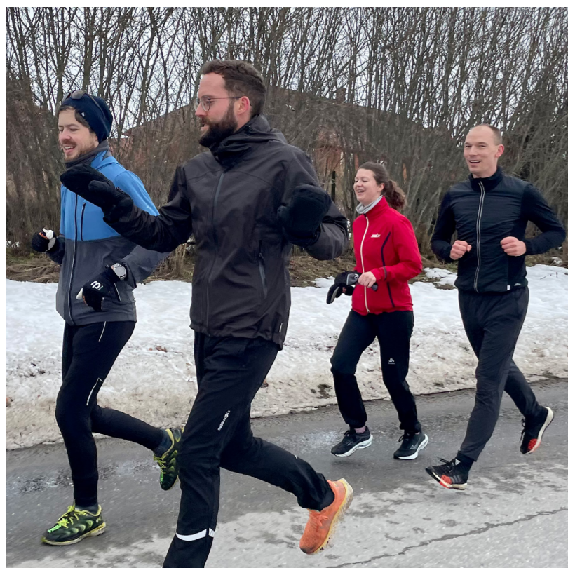
På AYF-samlinger legger vi opp til både faglig påfyll og rekreasjon.