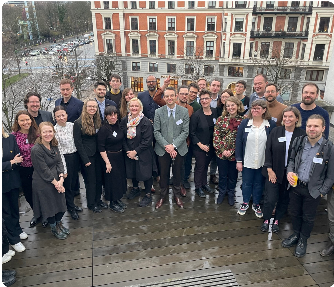
Medlemmer fra de unge akademiene i de nordisk-baltiske landene samlet i København.

2.-3. April var det Det Unge Akademi i Danmark sin tur å være vertskap for det årlige Nordisk-Baltiske møtet. Dette var i Det Kongelige Danske Videnskabernes Selskab sine ærverdige lokaler i København. Møtet ble flyttet tilbake til våren etter at vi arrangerte møtet i kombinasjon med Lettenprisutdelingen i september 2023.