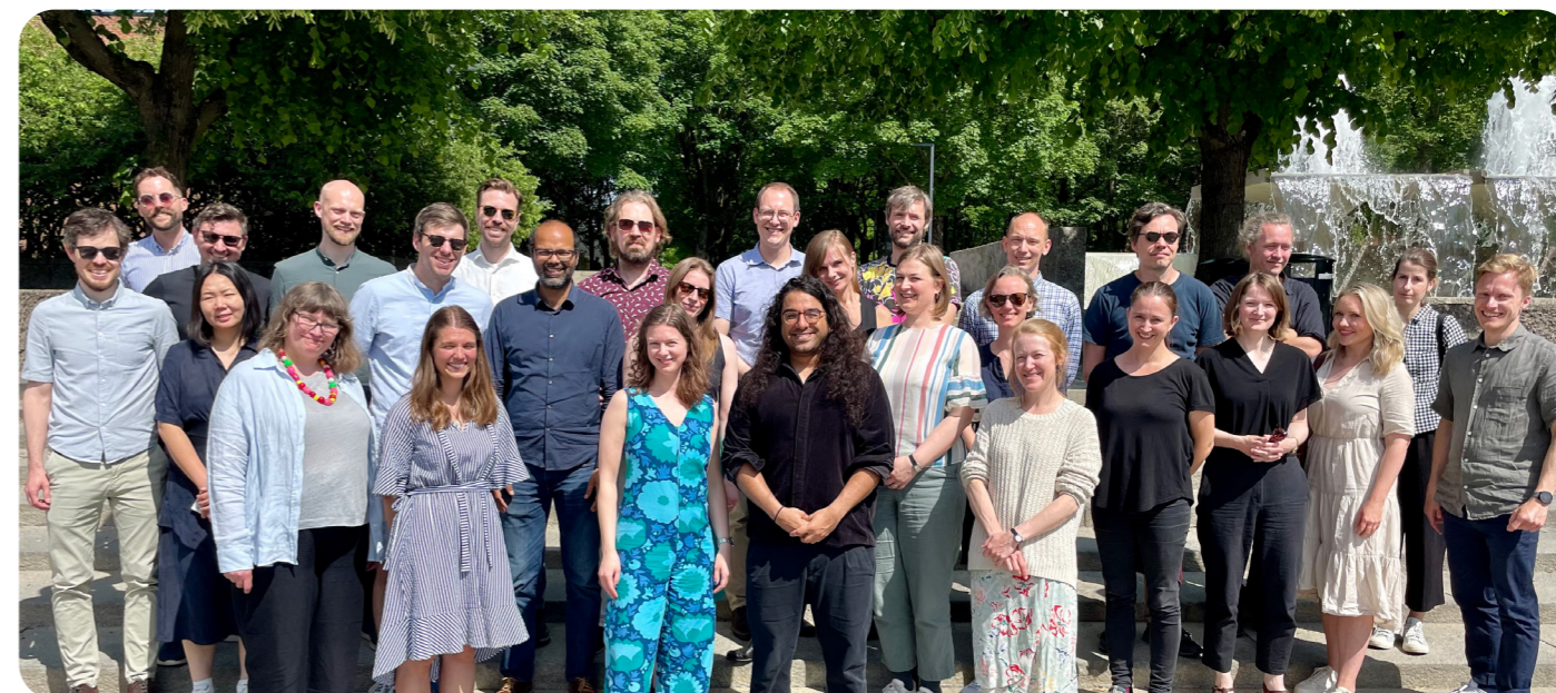
AYF-medlemmer på sommersamling på Blindern.