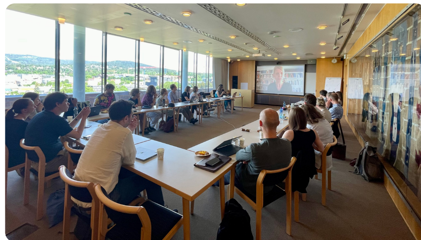
Videohilsen fra Det Unge Akademi i Danmark.