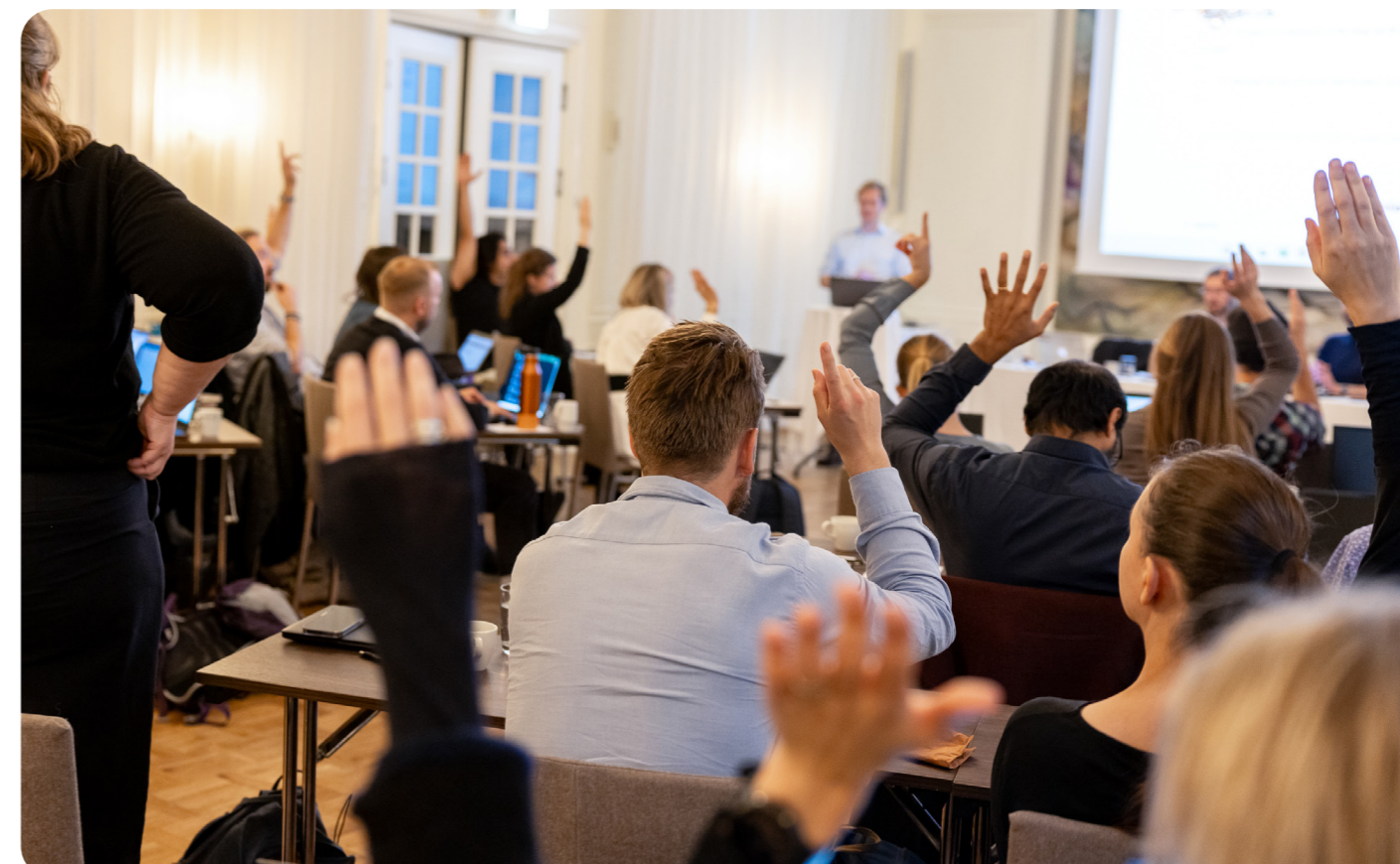
Fra avstemming under generalforsamlingen i Bergen 2024.