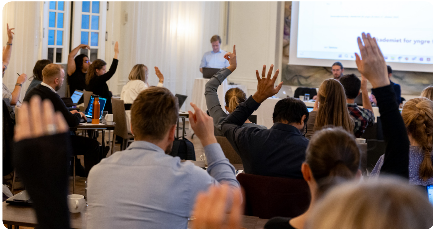
AYF-medlemmene avgir sine stemmer på høstsamlingen i Bergen 2024.