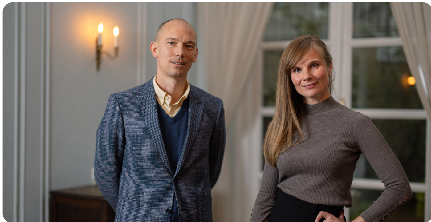
Ny ledelse på plass fra høstsamlingen 2024.